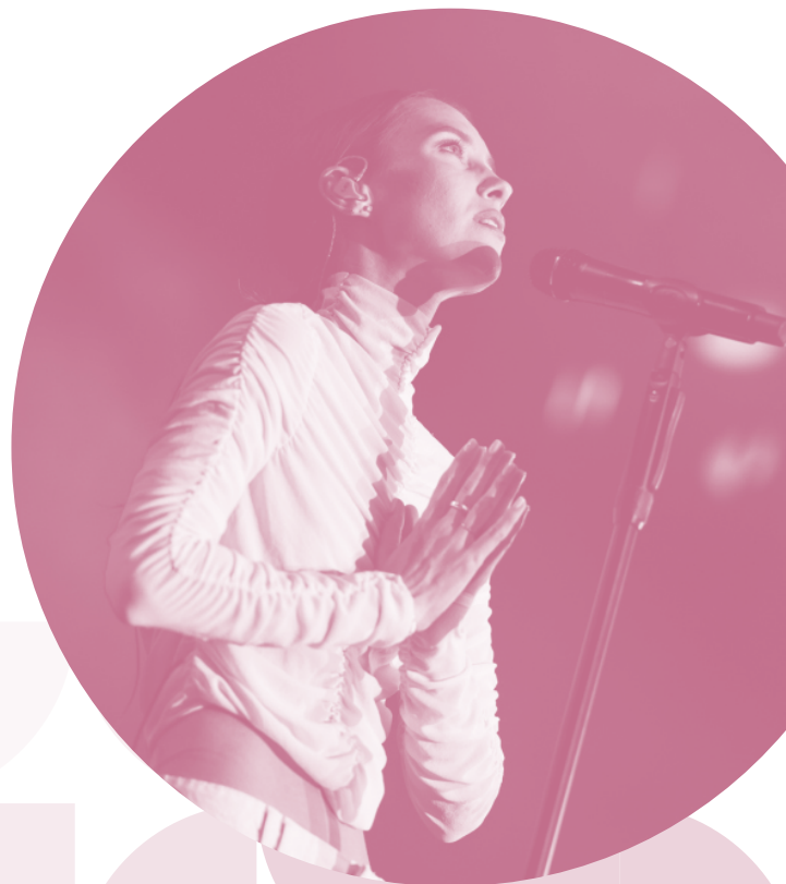
Miesto muzikos festivalis „Untold City“, „Saulės kliošas“ koncertas, 2022 m.